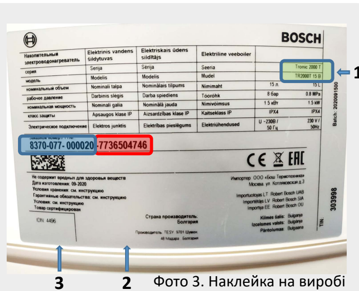
Фото 3. Наклейка на виробі

Для газових та електричних котлів, а також газових проточних водонагрівачів, використовується інший вид гарантійного талону, на лицьовій стороні якого відсутня піктограма обладнання, а в Полі 1 (Тип пристрою), не зазначено виду обладнання. Для побутових кондиціонерів передбачено окремий талон, який має зображення внутрішнього блоку кондиціонеру на лицьовій стороні, а також анотацію «побутовий кондиціонер» в полі (Тип пристрою)